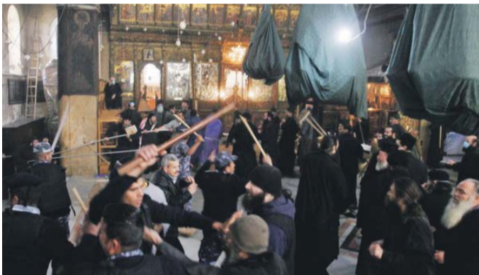
Örmény és görög szerzetesek karácsonyi összetűzése Betlehemben, a Születés templomában

► Ma földünk 236 országából 130-ban tapasztalható kemény keresztényüldözés vagy a kisebbségi vallások diszkriminációja az Egyesült Államok Kongresszusának Nemzetközi Vallásszabadság Bizottsága, továbbá a Nemzetközi Keresztény Szolidaritás (CSI) és húsz más szervezet egybehangzó jelentése szerint. Csak 2011-ben kétszáz ezer keresztényt üldöztek el hazájából, öltek meg, zártak börtönbe vagy félemlítették meg hitük miatt. Ugyanakkor milyen arcpirító, csaknem komikus abszurdum, hogy karácsonykor a betlehemi Születés-templomban közel száz örmény és görög ortodox keresztény pap és szerzetes esett egymásnak sóprúkkal és botokkal, és a – feltehetőleg többségében muszlim – palesztin rendőrségnek kellett megfékeznie őket. Ilyen helyzetben óriási jelentősége van minden kezdeményezésnek, amely a keresztények és a vallások közötti megbékélést munkálja. A keresztény egység imahete mellett ugyan csepp a tengerben, de mégis létezik másfajta, ezt kiegészítő kezdeményezés is, amelyre érdemes odafigyelni. Ilyen a múlt év szeptembere óta az Egyesült Államok Dél-Kalifornia államában működő Claremont Lincoln Teológiai Akadémia, amely a világ első vallásközi egyeteme.