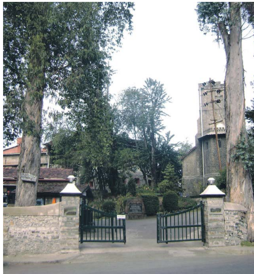
A Kodaikanal International School bejárata