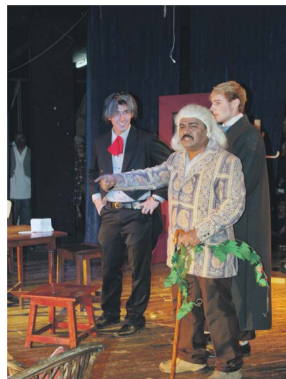
Dickens Karácsonyi énekének indiai előadása